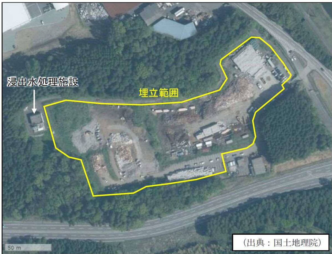
旧杉水埋立処分場