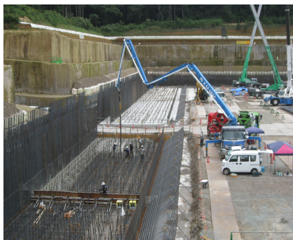
耐圧盤下のコンクリート打設をおこなっています。