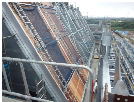
蒸気復水器組立工事